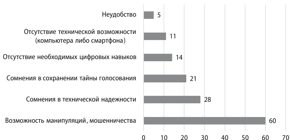
Рисунок 2. Причины отказа избирателей от использования дистанционного электронного голосования (в %)

В сентябре 2021 года 35 процентов избирателей высказали критическое отношение к применению дистанционного электронного голосования в избирательном процессе, что свидетельствует о неуверенности представителей общества в его надежности, достоверности, а также о неготовности многих граждан к его полноценному использованию в качестве замены традиционных форм голосования. Исследование ВЦИОМ, проведенное в 2020 году, показало, что 69 процентов избирателей при возможности выбора способа голосования предпочли бы использовать традиционный бумажный бюллетень. Это означает, что в электоральной среде сохраняются как технологические, так и репутационные ограничения (рисунок 2) [8].