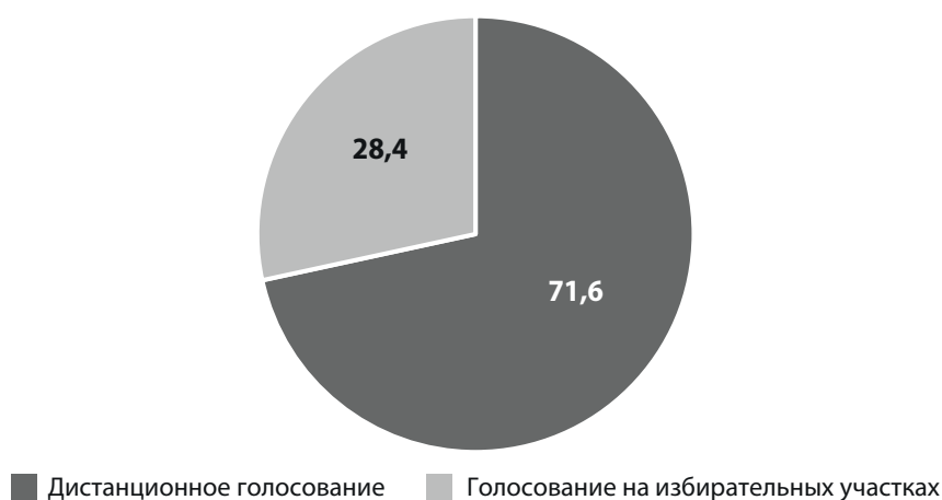
Рисунок 3. Выбор избирателями способа голосования на муниципальных выборах 2022 года в Москве (в %)

проголосовать дистанционно: если во время эксперимента 2019 года дистанционно проголосовало только 2 процента избирателей, то во время довыборов муниципальных депутатов — уже более 7 процентов. Также было обеспечено значительное повышение явки избирателей: до 22,6 процента против 12,8 процента на предыдущих муниципальных выборах [10]. Создание условий для широкомасштабного применения цифровых технологий в избирательном процессе в Москве позволило привлечь к участию в муниципальных выборах избирателей, не посещавших ранее избирательные участки. Уже в 2022 году на муниципальных выборах удельный вес избирателей, проголосовавших дистанционно, превысил 70 процентов (рисунок 3) [11].