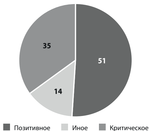
Рисунок 1. Отношение избирателей к возможности использования дистанционного электронного голосования (в %)

В сентябре 2021 года 35 процентов избирателей высказали критическое отношение к применению дистанционного электронного голосования в избирательном процессе, что свидетельствует о неуверенности представителей общества в его надежности, достоверности, а также о неготовности многих граждан к его полноценному использованию в качестве замены традиционных форм голосования. Исследование ВЦИОМ, проведенное в 2020 году, показало, что 69 процентов избирателей при возможности выбора способа голосования предпочли бы использовать традиционный бумажный бюллетень. Это означает, что в электоральной среде сохраняются как технологические, так и репутационные ограничения (рисунок 2) [8].